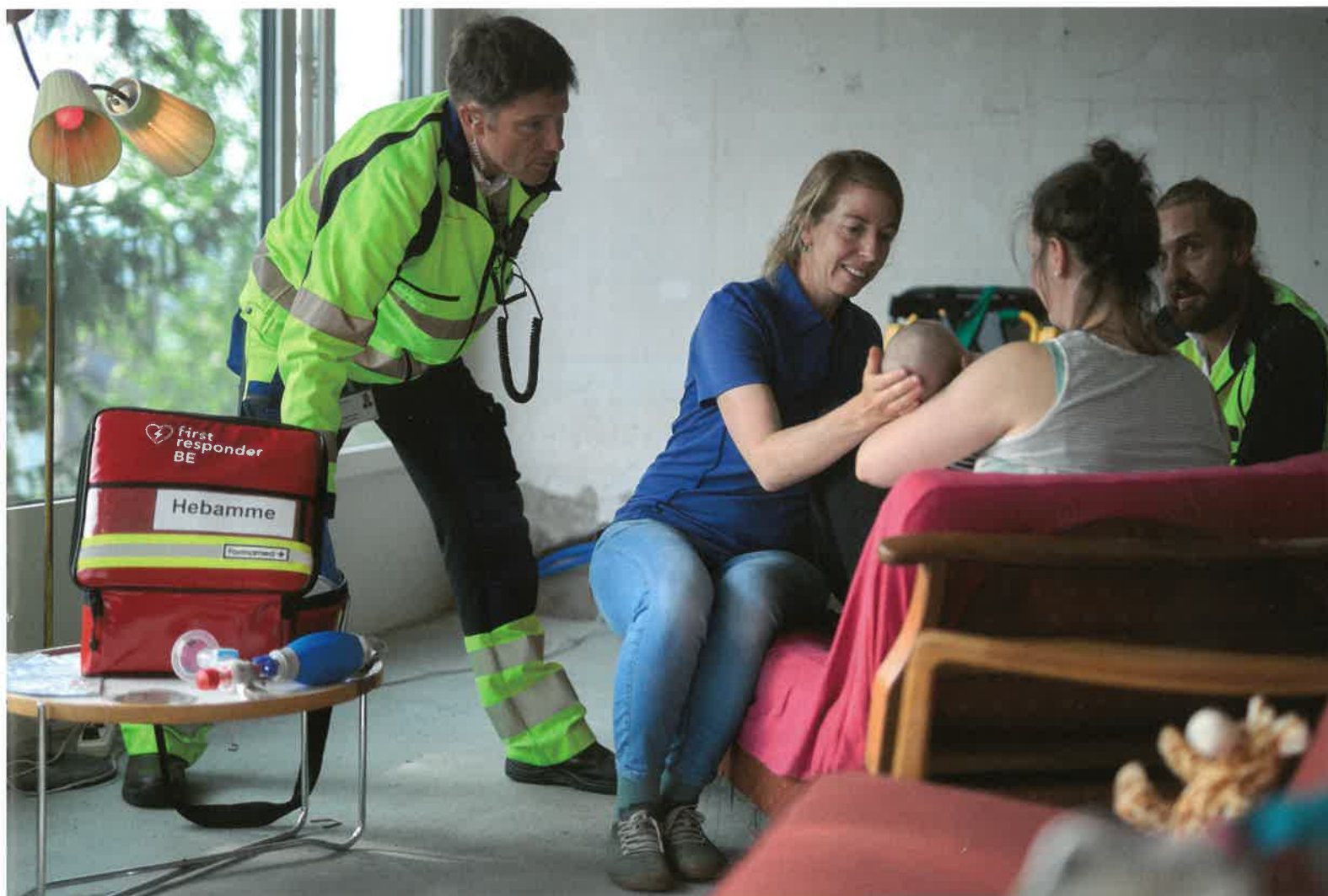
Zusammen mit dem Rettungsdienst im Einsatz: die Rapid-Responder-Hebamme. Links im Bild ist die Einsatztasche der Hebamme zu sehen.

La CASU joue un rôle clé pour garantir une mobilisation homogène des SFRR. Des mots-clés d'intervention